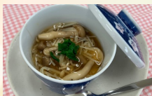
協力：見附市健康福祉課健康づくり係

卵には集中力、記憶力アップに効果が期待できるレシチンが含まれています。さらに、ブドウ糖やDHA、各種ビタミン・ミネラルなどを多く含む食品と組み合わせることで、脳力リフレッシュ効果が期待できます。例えば鯖料理をメインに、白米、具沢山味噌汁、茶碗蒸しをそろえた夕食はいかがでしょうか。